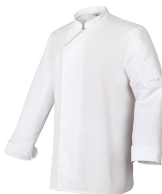
Blanc - Ecreu