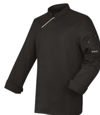
Noir - Ecreu